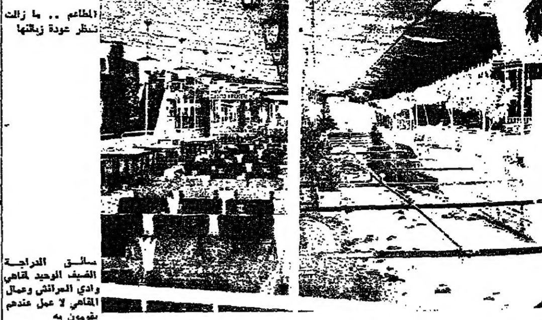
سائق الدراجة السيد الوحيد قاضي في سوق عادتها

زحلة - من عيد الاشر : دعا التجمع الزحلي العام الى اقامة لامركزية سياحية في لبنان ، والتي اجراء مع سياحي شامل يقدر الاضرار التي لحقت بالقطاع السياحي.